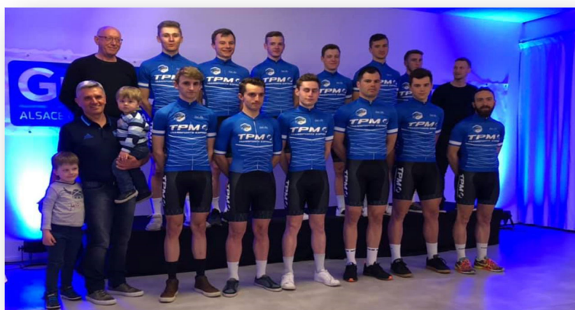
Equipe DN2 Route