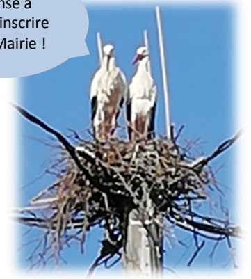
Nid rue de la Paix