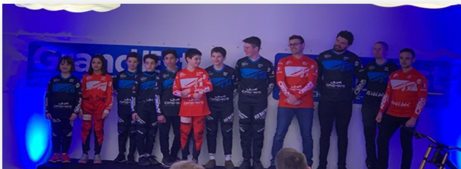
Team BMX et Equipe DN3 VTT

Un très bon moment partagé, avec une visite du stade accompagné d'un repas dinatoire.