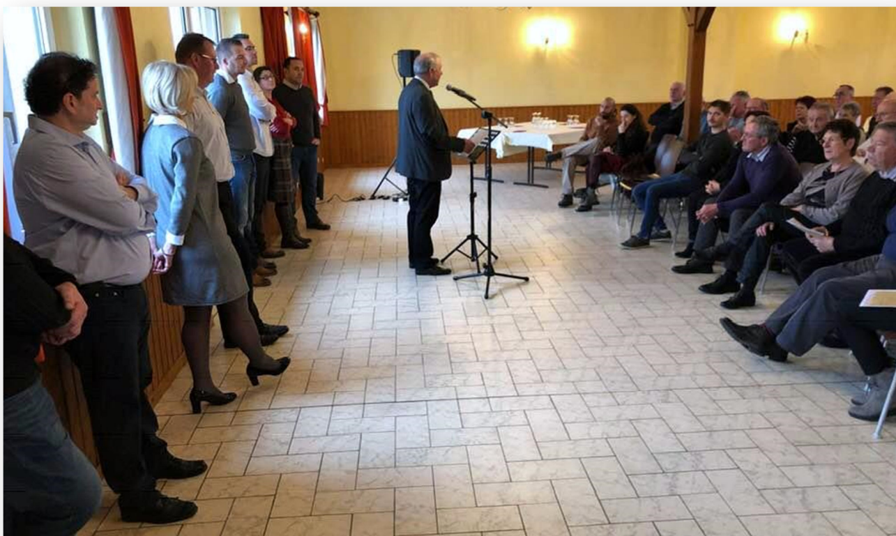
Cérémonie des vœux du Maire - le 13 janvier

Photos de couverture : Fête des personnes âgées le 24 mars Cerisier du Japon en fleurs rue de Saverne